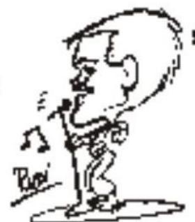
Autor; Rudi Mennes

Versandkosten Inland nach Gewicht: bis 500g € 2,00 / bis 1kg € 3,00 / bis 2kg € 5,00 / bis 5kg € 7,00 höheres Gewicht und für Ausland angepasstes Porto