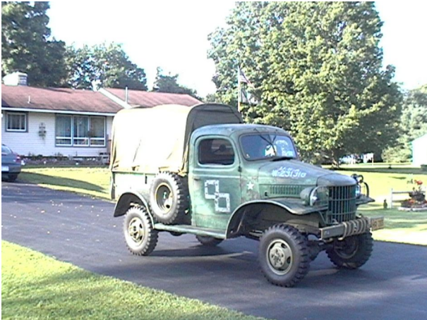
Auch Kennzeichnung von Fahrzeugen Although emblems on vehicles