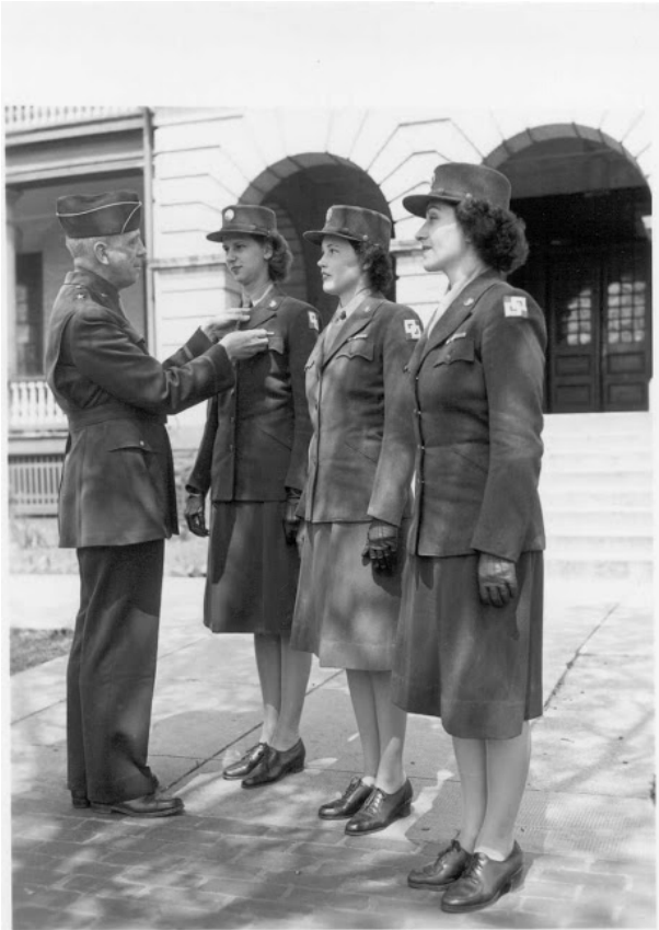
die Soldatin rechts hat das Emblem rückwärts aufgenäht soldier on the right has her insignia sewn on backwards