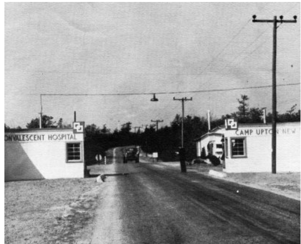
Eingang zum Camp Upton Convalescent Hospital entrance to the Camp Upton Convalescent Hospital

With the reorganisation of the unit after the war the insignia was available. A new appearance of this insignia can be seen on a helmet, however belonging to a member of the 6 th army. It is assumed, that MG stands for Military Guard. They were responsible for POW (prisoner of war) camps. Alternatives could be a honor guard or similar.