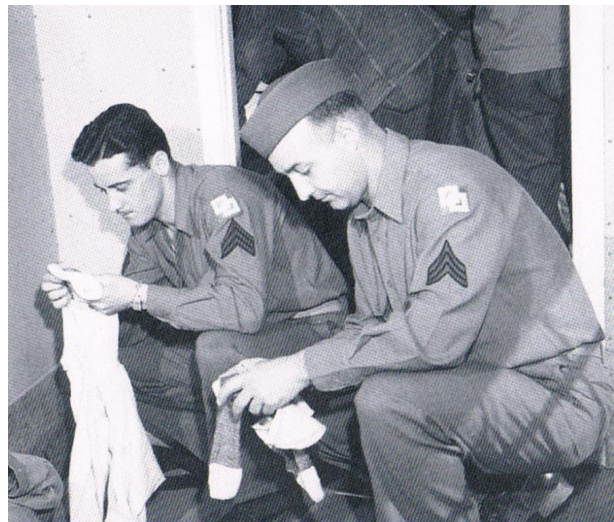
Soldaten durchsuchen das Eigentum einer U-Boot crew soldiers looking through the U-Boat crew's belongings