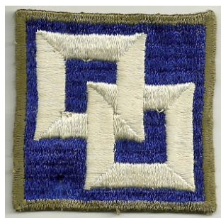
Alternatives Emblem mit olivfarbener Umrandung Alternative insignia with an olive drab border

Um die Angaben des ersten Teils zu korrigieren, das Second Service Command wurde bereits im Sommer 1941 gegründet. Das Bild zeigt Mitglieder des Women's Army Corps (WAC) mit dessen Emblem. Dieses wurde am 14 Oktober 1941 neu genehmigt.