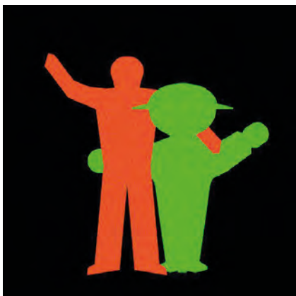
Symbol für die Deutsche Wiedervereinigung auf dem Flyer der Square Breakers Recklinghausen / symbol for the German Reunion on the flyer of the Square Breakers Recklinghausen

Aktuellster Beitrag aus den NBL: Im Bulletin February 2016 S. 15 wird über die Contra Convention in Plauen 2015 berichtet.