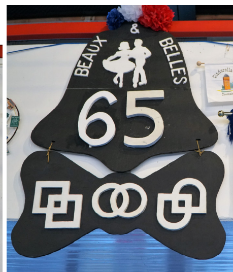
65 Jahre / Years Beaux & Belles