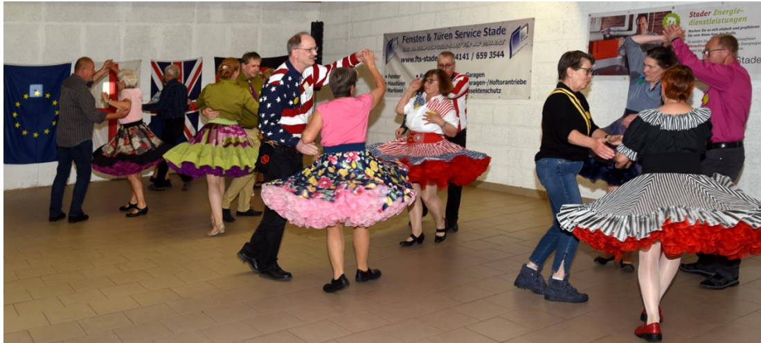
At the dance / Beim Tanz