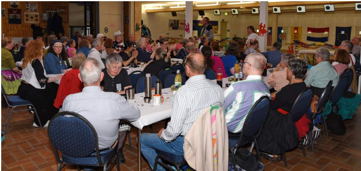
View into the "Schuetzenhalle" / Blick in die Schützenhalle