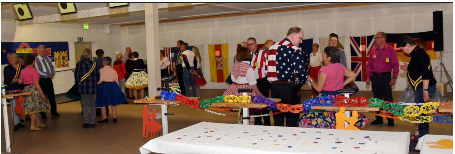
Ready to dance / Bereit zum Tanz